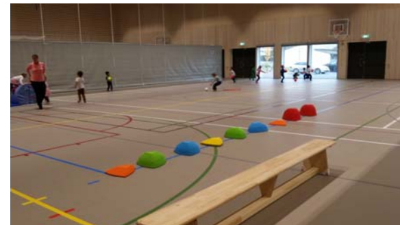
Lek i gymsalen på Hegg skole